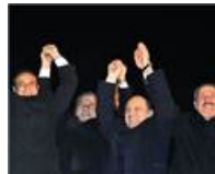
Komisyon sona erdi! İşte karar...