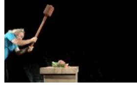
Okyanuslardan Korkmanız İçin 17 Geçerli Sebep