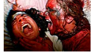
Tüm Kâbusların Bir Araya Geldiği, İçine Gireni Ağlatan, Yeryüzündeki En Ürkütücü Korku Evi