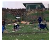
Kadınlar taş atan çocuklara taşla yanıt verdiler