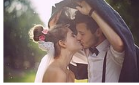
Gördükten Sonra Yağmurlu Bir Günde Evlenmek İsteyeceğiniz 15 Düğün Fotoğrafı