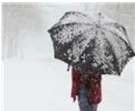
Meteoroloji uyardı! Bu gecedен itibaren...