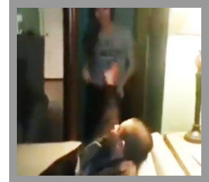
Kız arkadaşına öyle bir yumruk attı ki!