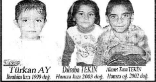
Kayseri'deki çocuklar 8 aydır kayıp.