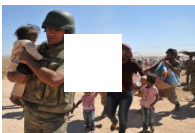
Mehmetçik sığınmacılara yardım elini uzattı