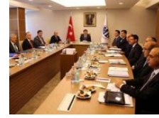
Maliye Bakanlığı Bilgilendirme Toplantısı

Meclis Başkanı Çiçek, soru-cevap bölümünde kendisine yöneltilen çözüm süreci, komşu ülkelerle ilişkiler konularındaki soruları cevaplarken, "Türkiye, gerek içeriden, gerek dışarıdan, doğru yanlış, haklı haksız her türlü eleştiriye de açıktır. Dolayısıyla zaman zaman dışarıdan da içeriden de gerek uygulamalarla ilgili, gerekse ortaya konulan çalışmalarla, çabalarla ilgili eleştiriler gelebilmektedir. Bunları biz dikkatle değerlendiririz. Nitekim bu eleştiriler sadece son zamanda değil, konuşmamda da ifade ettim, Türkiye'nin temel tercihi stratejik tercihi Avrupa Birliğine üye olmaktır" diye konuştu.