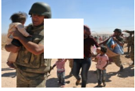
Mehmetçik sığınmacılara yardım elini uzattı