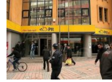
PTT ülke genelinde e-imza satışına başladı